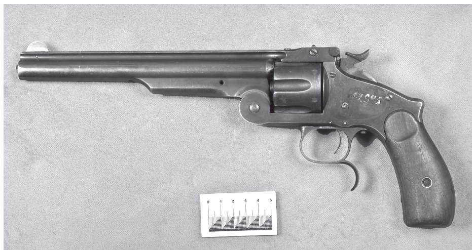
Револьвер Смита — Вессона русской модели

В целом арсенал короткоствольного огнестрельного оружия в коллекции Новосибирского государственного краеведческого музея невелик, но достаточно разнообразен и включает в себя как дульнозарядные капсюльные пистолеты, так и револьверы и автоматические пистолеты.