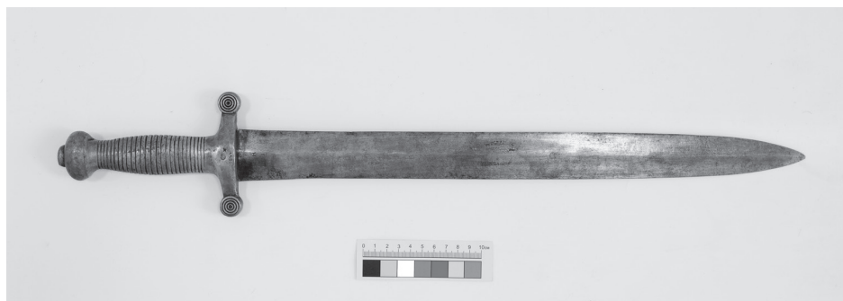
Пехотный солдатский тесак образца 1848 г.

Тесак рассматривался скорее как хозяйственный предмет, выполняющий функцию, например, топора и дающий возможность нарубить дров, вырубить кустарник, изготовить фашины (связки хвороста, используемые при строительстве оборонительных сооружений) — отсюда происходит один из вариантов названия подобного рода оружия — «фашинный нож». Примеры боевого применения тесаков показывают, что за них брались только тогда, когда других средств для обороны не оставалось. При необходимости тесаки можно было использовать для изготовления простейших носилок, в силу чего в некоторых армиях тесаками вооружались и санитары. Деревянные рукояти специальных саперных и артиллерийских тесаков подвергались большим нагрузкам (особенно при рубке дерева), вследствие чего часто ломались, поэтому во многих армиях тесаки стали оснащать литыми латунными рукоятями, которые хоть и утяжеляли оружие, но в то же время делали его более устойчивым к механическим перегрузкам. Некоторые тесаки снабжались гардами закрытого типа с защитной дужкой, что подразумевало использование тесака для личной самообороны в рукопашной схватке.