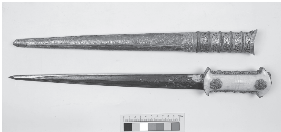
Турецкий кинжал XVIII в.

Кинжал-джамбия имеет сильноизогнутый, относительно короткий и широкий у рукояти клинок с ребром жесткости посередине. Оружие происходит из Йемена, где является традиционной принадлежностью мужского костюма и носится заткнутым за пояс из дубленой кожи или плотной ткани. Роговая рукоятка имеет фигурную форму с узкой средней частью и украшена двумя латунными бляшками, имитирующими монеты, изогнутые ножны джамбии обтянуты кожей и оплетены кожаным шнурком. Традиционно джамбия — боевой кинжал, однако сегодня это скорее парадный элемент костюма — отцы дарят их подросткам, когда те достигают возраста зрелости.