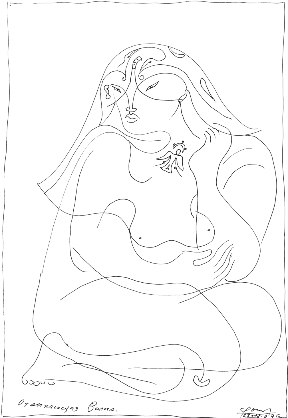
С. Дыков. Отдыхающая Волна. 2007