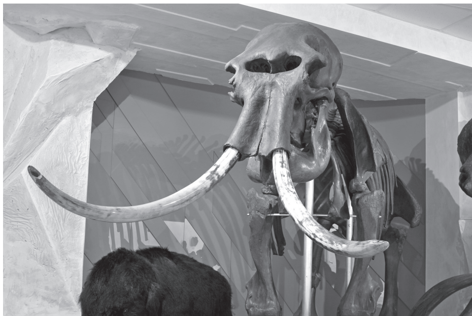
Скелет самки мамонта (Оешский мамонт)

Прибывшие в Вахрушево сотрудники музея и геологи совместно с жителями деревни произвели раскопки, в результате которых был обнаружен практически полный скелет мамонта, сразу же доставленный в музей. Так как животное погибло, увязнув в топком берегу реки, то все кости сохранились целыми и располагались в анатомическом порядке. Сначала из-за скромных размеров скелета и небольших бивней находку определили как скелет молодого мамонта, но при более внимательном изучении было установлено, что скелет принадлежит взрослой самке, которую сотрудники музея в дальнейшем назвали Матильдой.