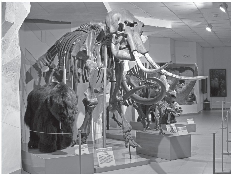
Скелет самки мамонта (Оешский мамонт)