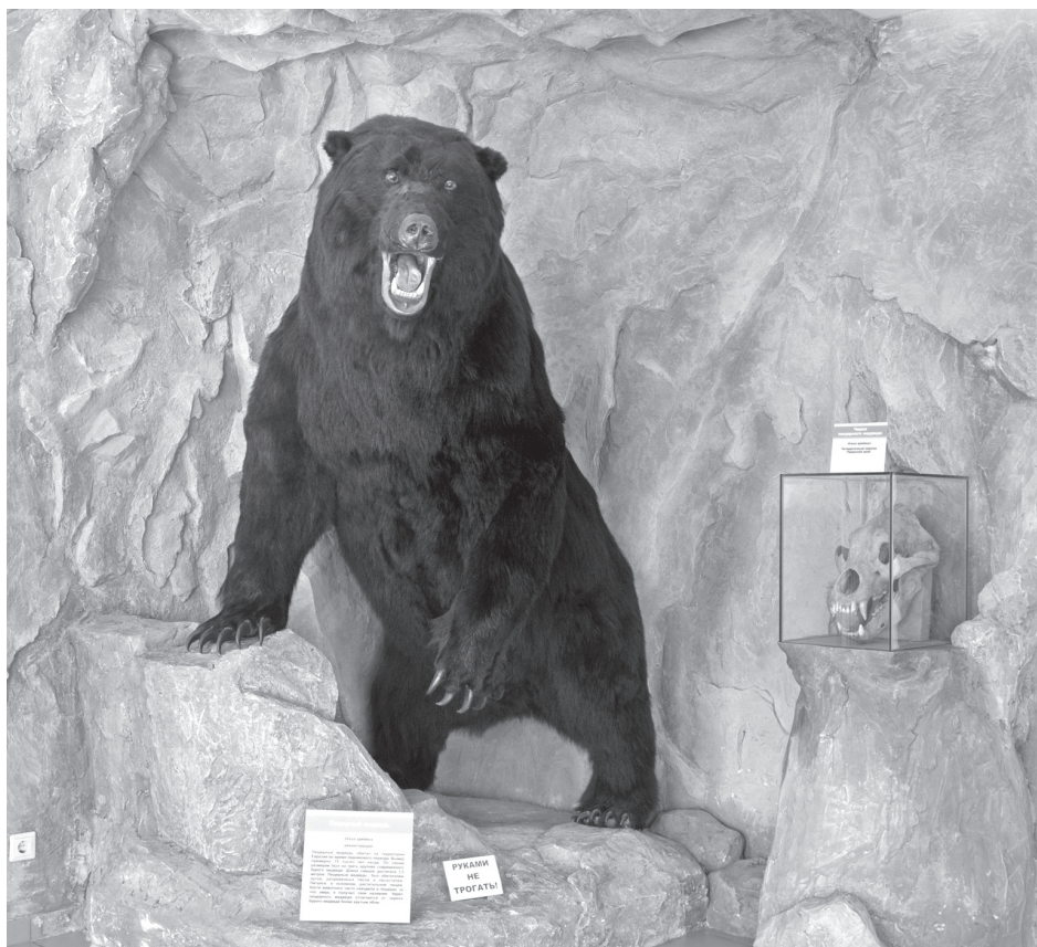
Реконструкция пещерного медведя

Данный экспонат не входит в состав палеонтологической коллекции, однако стоит его упомянуть как один из ярких экспонатов в палеонтологической экспозиции. Реконструкция была выполнена в таксидермической мастерской в 2011 году, и на ее изготовление ушло четыре шкуры бурого медведя.