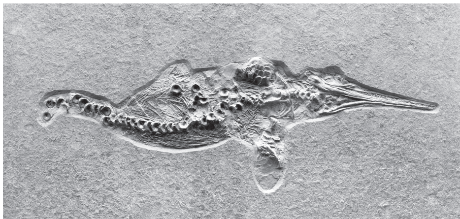
Скелет ихтиозавра в сланце

Ихтиозавры — морские рептилии, существовавшие на протяжении почти всей мезозойской эры. Внешне этот ящер похож на рыбу, что и дало ему название, ведь «ихтиозавр» в переводе с латыни означает «рыбоящер».