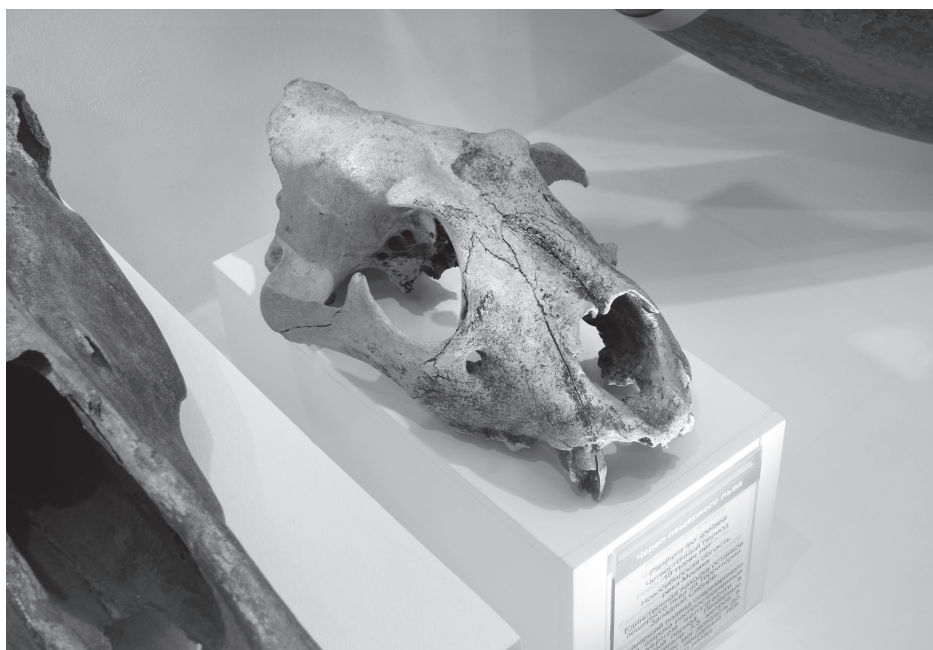
Череп пещерного льва

Помимо полного скелета животного, важным объектом для изучения является также и череп. В отличие от отдельных костей скелета, он несет в себе много информации: по черепу можно представить облик животного, чем оно питалось (хищное или растительноядное) и многое другое.