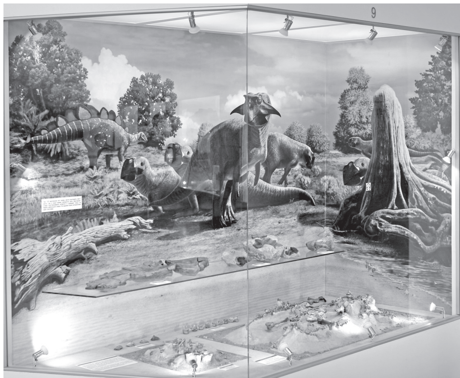
Витрина с фрагментами скелетов пситтакозавров сибирских в известняке

Все эти находки были сделаны в геологическом обнажении «Шестаковский яр» (или «Шестаково-3»), которое представляет собой обрывистый берег реки Кии (Чебулинский район Кемеровской области). Шестаковский яр сложен породами мелового периода, в которых, кроме вышеуказанных находок, обнаружено большое количество других меловых животных: разные виды