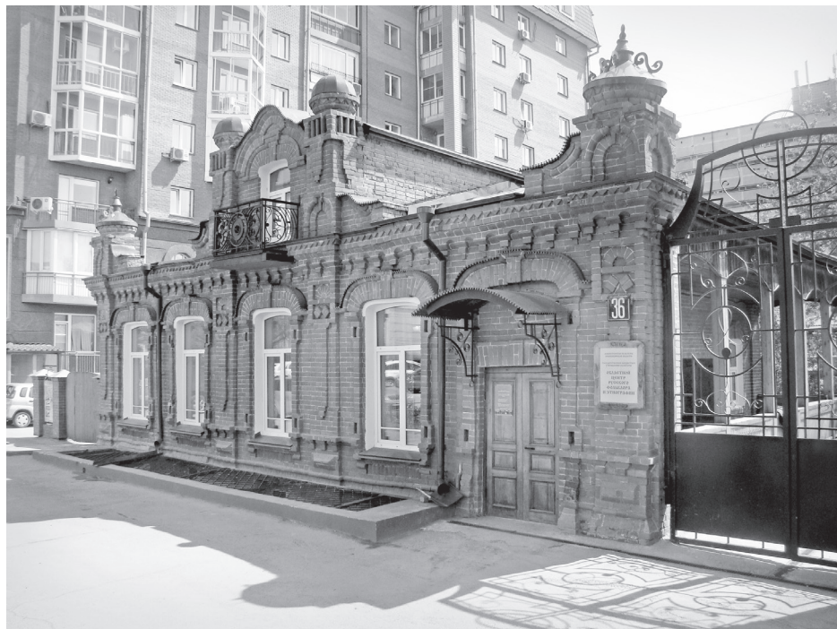
Областной Центр русского фольклора и этнографии. Фонд-архив ОЦРФИЭ

Следует отметить, что в организации и становлении областного Центра русского фольклора и этнографии как государственного учреждения культуры большую помощь и поддержку оказал известный сибирский ученый, фольклорист Михаил Никифорович Мельников. Вот что рассказывает о временах становления Центра В. В. Асанов: «В конце 1980-х годов фольклорное движение в России набрало силу. Так, в Екатеринбурге сначала