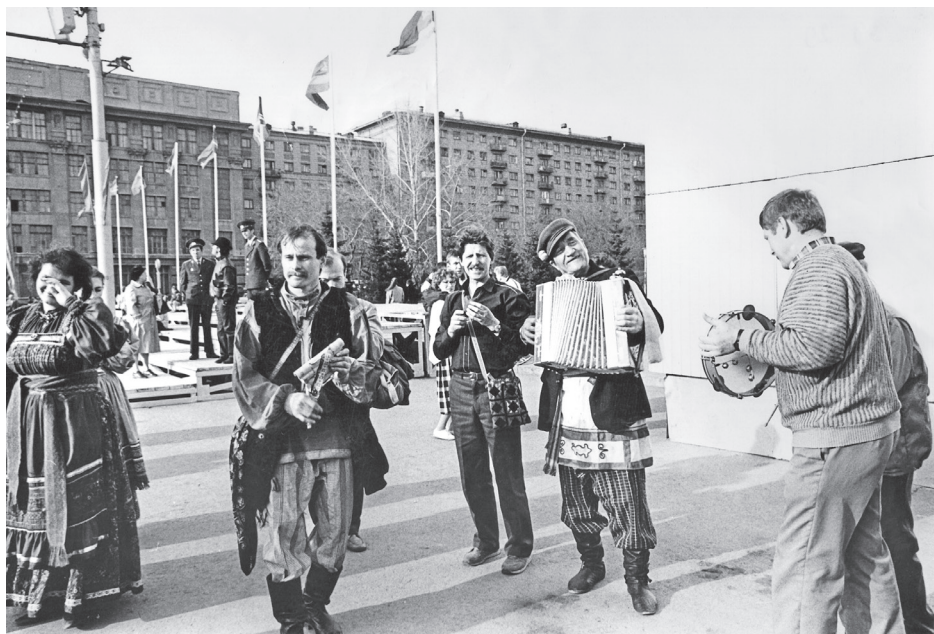
Участники Ансамбля сибирской народной песни на праздновании Дня города Новосибирска. 1989 г.

бирскую область; не менее востребован и необходим детский фестиваль-лаборатория «Жаворонки».