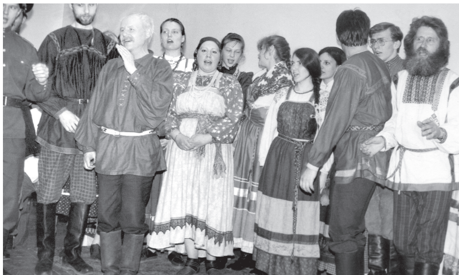
Областной Центр русского фольклора и этнографии проводит фольклорный фестиваль «На Кирилла и Мефодия». Окружной Дом офицеров, 1995 г.

Постепенно стало понятно, почему нет денег на экспедиции, на издание учебно-методических пособий и на многое другое — оказалось, что в управлении культуры Новосибирской области Центр русского фольклора и этно-