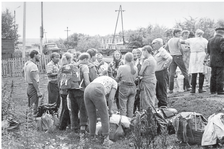
Фольклорная экспедиция областного Центра русского фольклора и этнографии. Село Первокаменка, Третьяковский район, Алтайский край. 1993 г. Фонд-архив ОЦРФиЭ

ва вышли четырнадцать книг и шесть сборников “Сибирский фольклор”, а художественные повести “Добродей” и “Северное сияние”, сказки, очерки и стихи печатались в журнале “Сибирские огни” и сборниках сибирских писателей и поэтов.