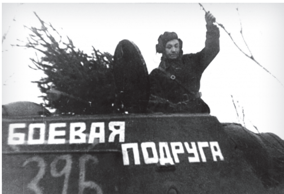
Мария Октябрьская на своем танке

К сожалению, танк М. В. Октябрьской «Боевая подруга» дошел до Берлина без самой Марии Васильевны. Она скончалась от осколочного ранения в голову в марте 1944 года, став единственной женщиной — Героем Советского Союза, воевавшей в бронетанковых частях.