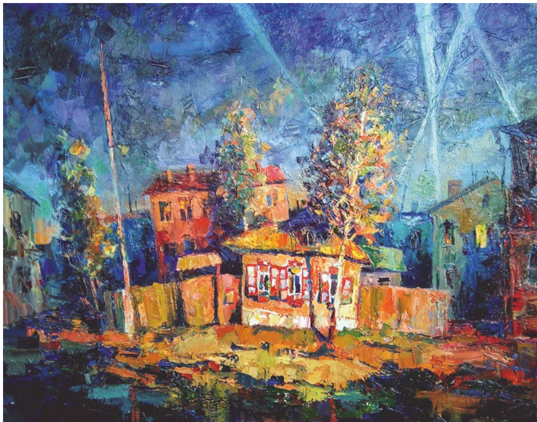
Виталий Казанцев. Июньская ночь. 2016

На первой странице обложки: Виталий Казанцев. Мост. 2023