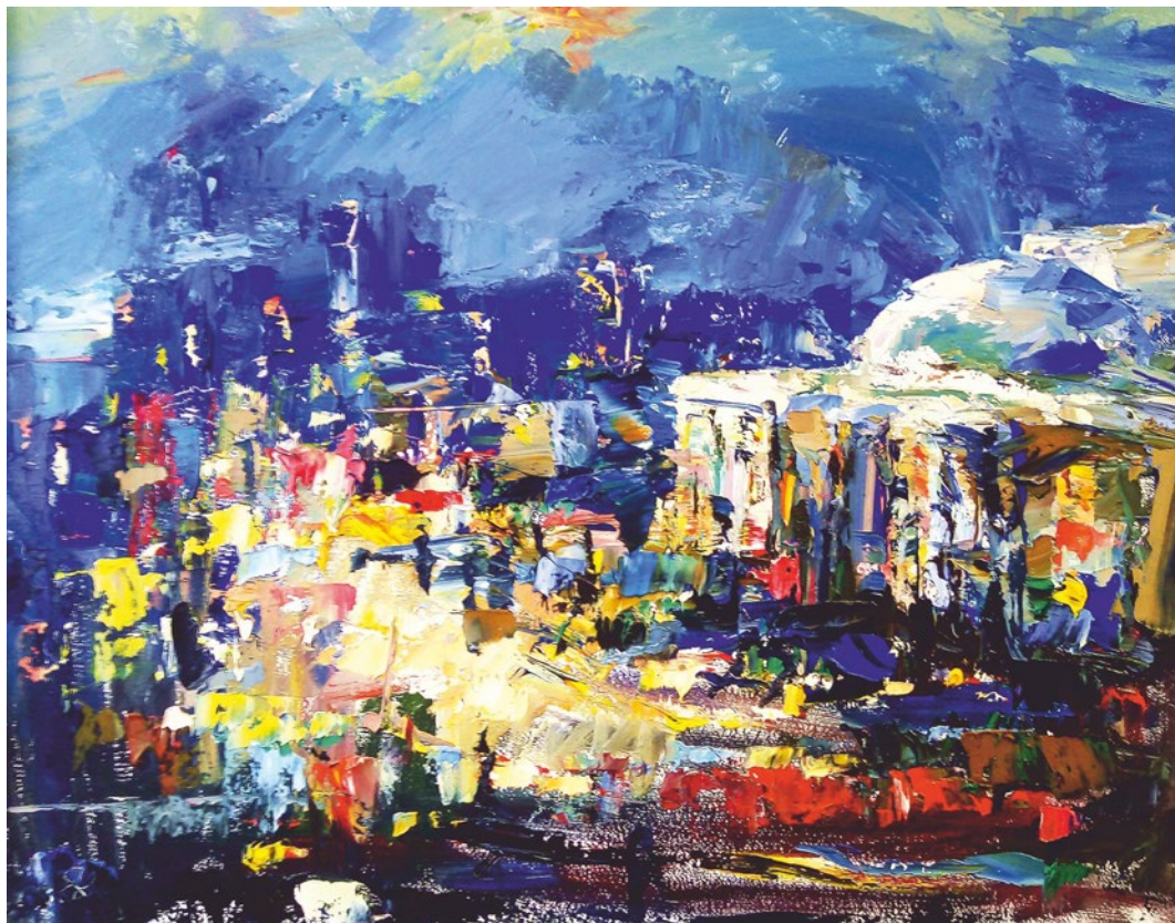
Виталий Казанцев. Оперный театр. 2019